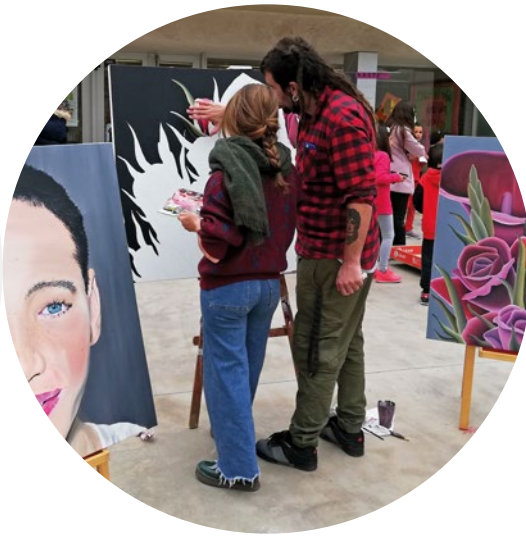
Escola Saavedra Tarragona

Aconseguir equilibrar la composició del centre amb la del seu entorn només és possible si al municipi existeixen unes condicions d'escolarització òptimes perquè les famílies vagin a aquest centre.