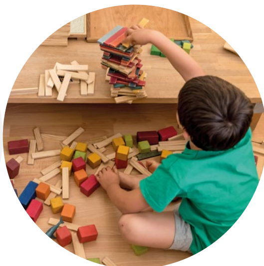
Escola Samuntada Sabadell