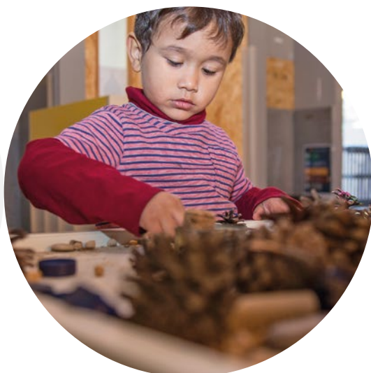
Escola Mas Casanovas Barcelona