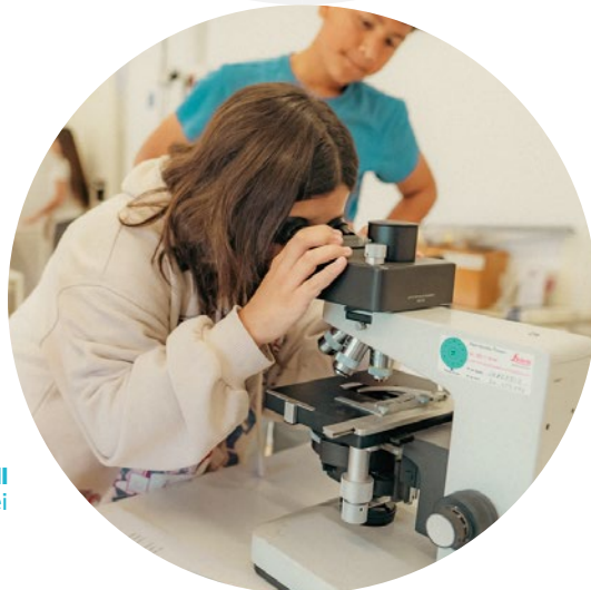
Escola Josep Maria Madorell Molins de Rei

Des de fa més de deu anys, Magnet accelera aquestes polítiques i acompanya els centres educatius perquè es converteixin en laboratoris de mesures contra la segregació escolar. Els aprenentatges de Magnet serveixen per impulsar la cohesió social al conjunt de la xarxa escolar.