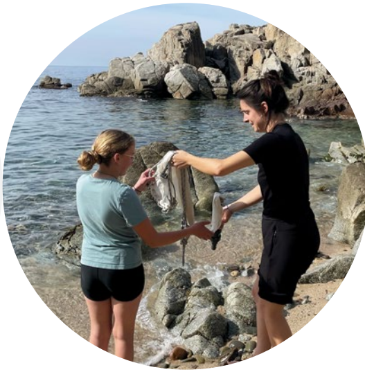
Institut Rocagrossa Lloret de Mar

El projecte Magnet és una punta de llança de la dessegregació d'escoles i instituts en el marc d'una estratègia de país per equilibrar socialment totes les aules de Catalunya. Aquesta voluntat compartida, que ja estava present en la Llei d'educació de Catalunya (2009), va cristal·litzar primer en la signatura del Pacte contra la segregació escolar (2019) i en el seu desenvolupament normatiu, com el Decret d'admissió (2021).