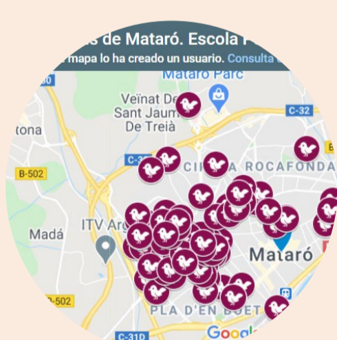
Escola J.M. Peramàs CREAM

Adapta els coneixements a la realitat educativa del centre.