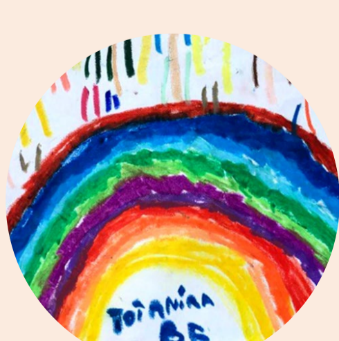
Escola Sant Ignasi Altahia

Fa visible l'aliança Magnet al web, xarxes socials i altres suports.