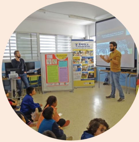
Escola Joaquim Blume CRM

Cada any l'escola felicita les festes de Nadal amb un curtmetratge rodat amb diverses tècniques cinematogràfiques.