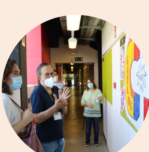
Escola Gayarre IBEC

En plena primera onada de covid, l'alumnat del centre va fer arribar cartes i dibuixos als malalts i als professionals sanitaris de l'Hospital St. Joan de Déu de Manresa.