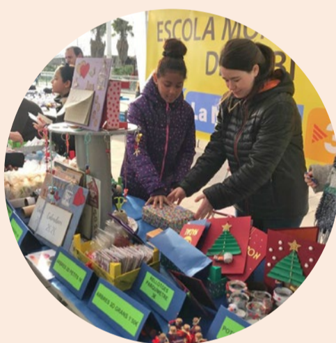
Escola Montessori CIM-UPC

Vuit anys després de l'inici de l'aliança el vincle segueix viu i el centre felicita l'aniversari del museu, recordant la transformació educativa des de l'art.