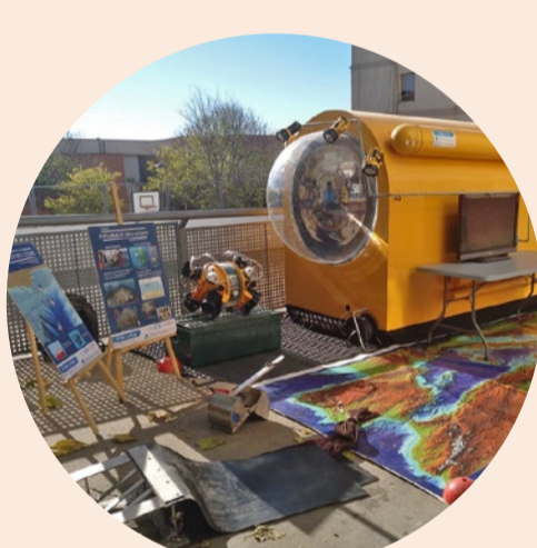
Escola Tanit ICM

En ple confinament, el centre i el CREAM elaboren una activitat perquè l'alumnat observi i estudi els ocells de Mataró.