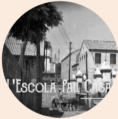
Escola Pau Casals Fílmoteca

Transmet els valors de la institució al centre a través de propostes concretes i tangibles.